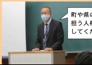
南部総合県民局の枝川次長