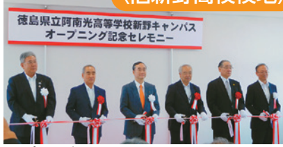
オープニング記念セレモニー 令和元年6月5日(水)