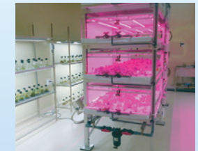
栽培室(LED照明による栽培棚)