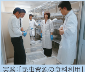
実験:「昆虫資源の食料利用」