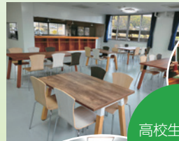
高校生によるカフェ実習