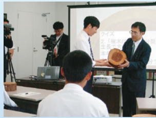
講義:「樹木・木材の基礎」