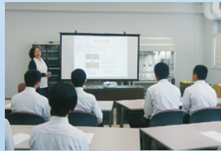
講義:「阿南の特産物と食」