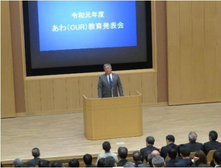
徳島県教育委員会教育長挨拶