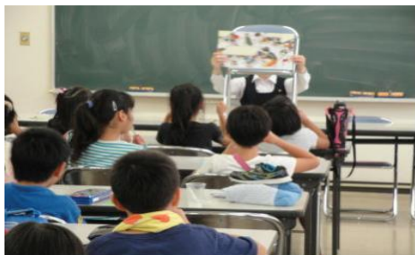
【熊本交流支援活動の実施】

県立高校生を中心に防災士（155人）を育成し、地域の成人防災士や小・中学生を巻き込んだ防災活動の推進