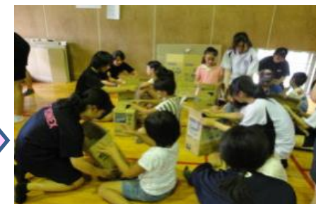
【小・中学生への指導】