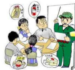
【講習会での図上訓練】