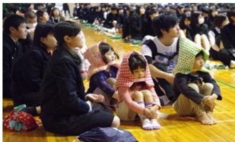
【地域と連携した避難訓練】