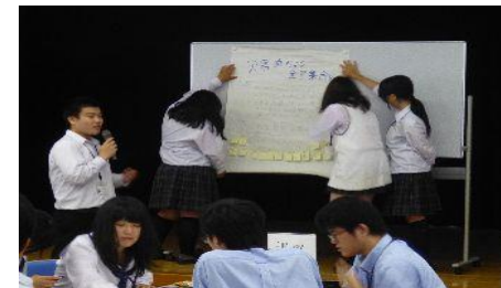
【ブロック別交流会】